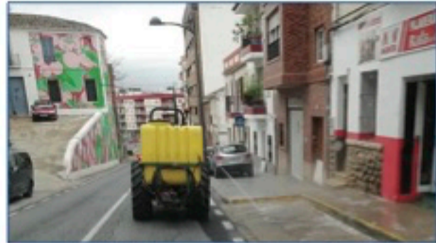
Las campañas de desinfección, como en Buñol, se han intensificado. ■ T.C.C.

La ciudadanía de la comarca respeta y participa concienciada en el confinamiento domiciliario. Chiva registra los dos primeros casos confirmados oficialmente de contagiados en la comarca.