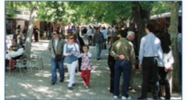
Las fiestas o las Ferias de Comercio, como la de Yátova, peligran. ■ T.C.C.

Nuestros Ayuntamientos toman medidas para combatir la propagación de la enfermedad