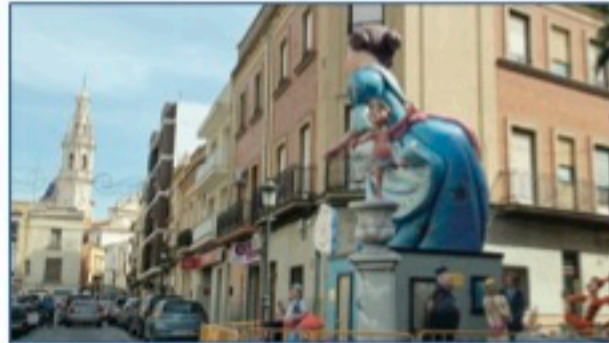
Cheste ha plantado y «desplantado» uno de sus monumentos. ■ T.C.C.